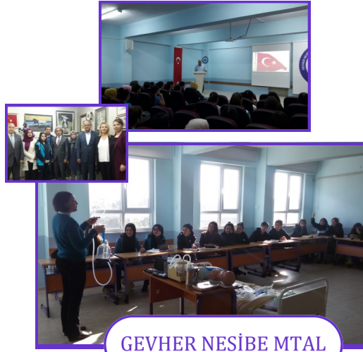
GEVHER NESİBE MTAL

Okulumuz modern yapısı ve çağdaş eğitim anlayışı ile öğrencilerimizi geleceğe hazırlamaktadır.